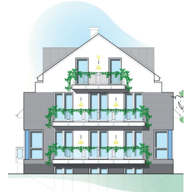
Straßenansicht 33 a

Es handelt sich um eine kleinere Einlegerstraße mit idylischem Charakter. Beginnend mit der kleinen Sankt Bernard Kirche im Norden führt der Weg, einer herrlichen Birkenallee folgend, entlang kleiner villenartiger Gebäude mit grünen Vorgärten in Richtung des südlich gelegenen Stormarnplatzes mit kleinen Geschäften, Märkten und Restaurants. Über eine kleine Brücke gelangt man in wenigen Minuten zum Alstertal Einkaufszentrum. Schule, Kita, Gymnasium und Wanderwege um die Alster befinden sich in unmittelbarer Nähe.