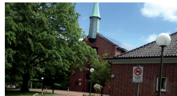
St. Bernhard Kirche

Tel.: 040 76797570 info@gm-glavac.de Langenstücken 29, 22393 Hamburg www.gm-glavac.de Fax: 040 76797569